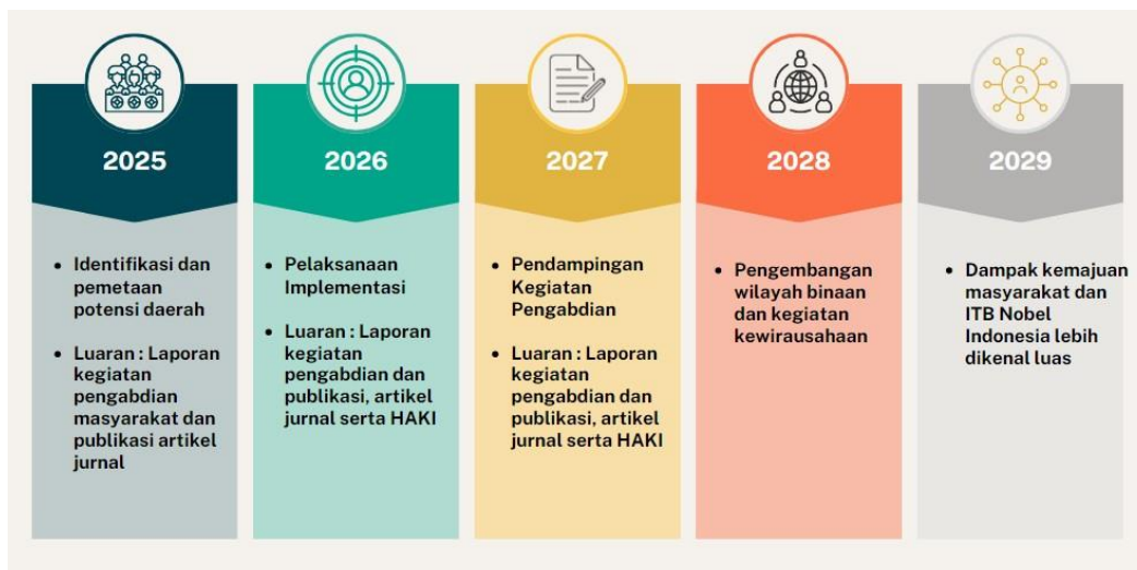
Gambar 2. Roadmap Pengabdian

Roadmap pengabdian kepada masyarakat ITB Nobel Indonesia dapat dilihat pada Gambar 2 sebagai berikut: